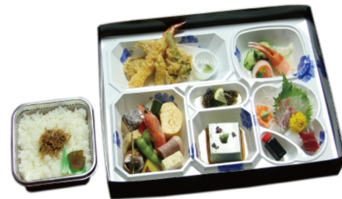
仕出し会席弁当 3,240 円