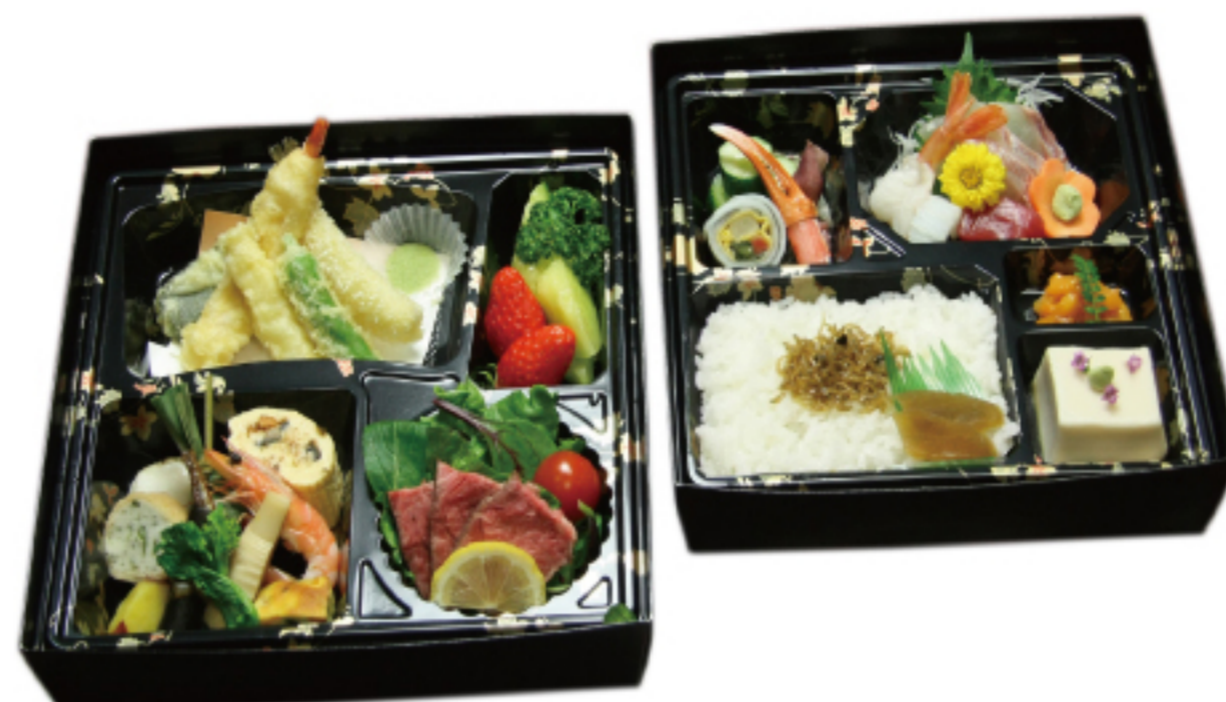
仕出し会席二段弁当 4,320 円